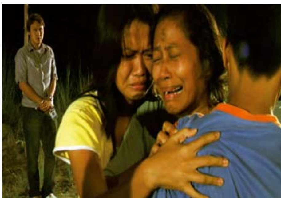
Fra den filippinske dokumentariske filmen Jay.

Tv-fotografen lener seg også over kiste-lokket så det detter ned: En tante hadde latt et par fargede kyllinger gå rundt og hakke på kisten, visstnok skulle det plage morderen, lokket knuser den ene. Dessuten stiller