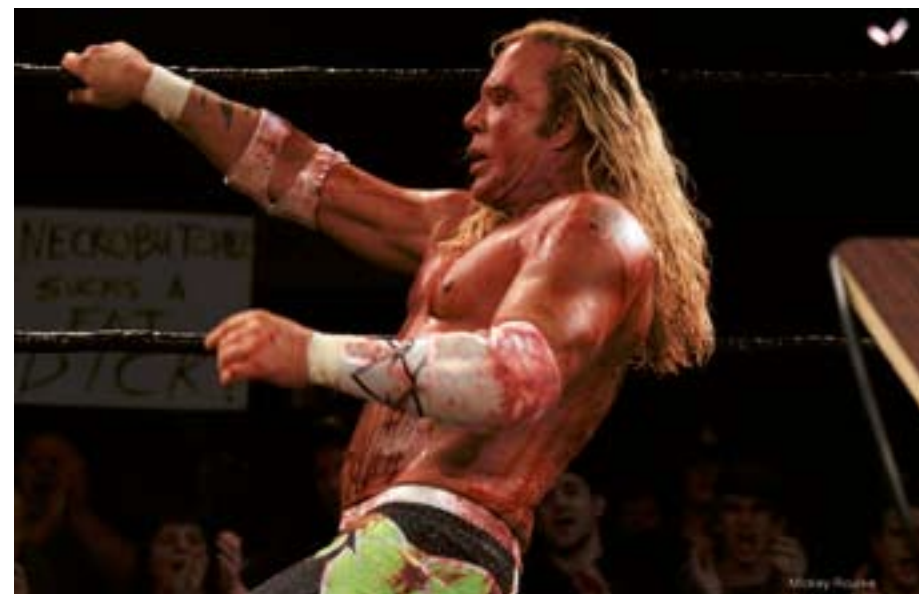
Fra venstre: Puisque nous sommes nés, Birdwatchers og The Wrestler.

å prøve å imøtegå dette med et par intellektuelle briller på Venezias sprengfulle pressekonferanse. På rundebordsintervju spør en kvinne om hans planer for framtiden og får svaret: «Have a lunch with you babe!» Filmen/Rourke minner meg om Robert de Niro i Raging Bull (1980), boksestjernens unngåelige fall fra toppen, han ender opp som vitsemaker på en bar – en skjebne Mascagnis tragiske musikk antydte underveis.